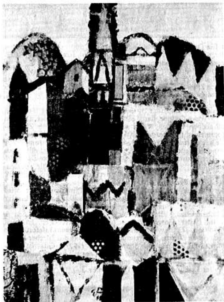
«Kleine Stadt am Hügel» ist eine der 133 ausgestellten Arbeiten aus dem Nachlass

Auf alle Fälle ist bei allen seinen Motiven, vom ersten bis zum letzten Bild, eine bisweilen fast melancholisch zu nennende Verhaltlichkeit spürbar. Es gibt kaum ein Werk, das nicht von subtiler Verklärtheit erfüllt wäre. Die gesamte, bis 24. August dauernde Ausstellung bereitet ungetrübten Genuss. (Während dem 27. Juli bis zum 8. August bleibt sie geschlossen.)